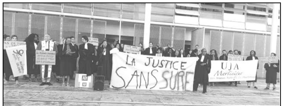
Avocats et magistrats mobilisés devant le palais de justice de Fort-de-France.

loi baptisé « SURE » pour « Sanction utile, rapide et effective ». Rien que cela ! Un « plaider-coupable » criminel qui pourrait être utilisé lorsqu'un accusé reconnaît les faits et que la victime ne s'y oppose pas. En échange, l'accusé bénéficierait d'une réduction d'un tiers de la durée de la peine encourue pour son crime. La procédure, mise en place sans procès d'assises et sans jury populaire, ni débat public, minimiserait de fait la place des victimes. Les syndicats des avocats et magistrats dénoncent aujourd'hui une orientation vers une justice de plus en plus dégradée et