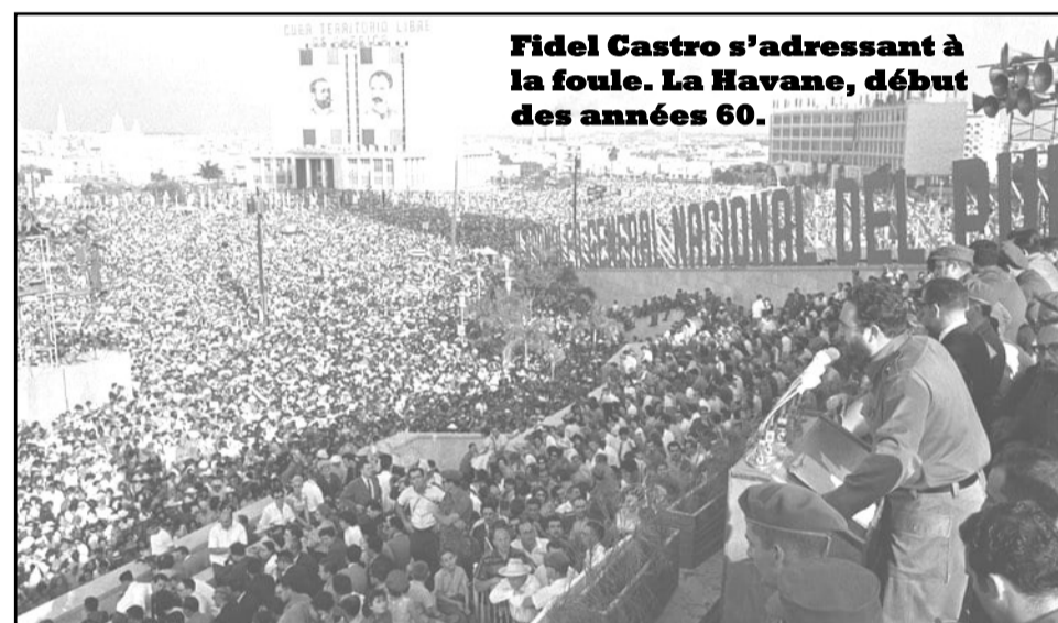
Fidel Castro s'adressant à la foule. La Havane, début des années 60.

Le monde était divisé en deux blocs avec d'un côté les États-Unis et ses alliés occidentaux et de l'autre l'URSS (Union des Républiques socialistes soviétiques) et ses alliés. Ces deux blocs ne se sont pas affrontés directement mais par des guerres