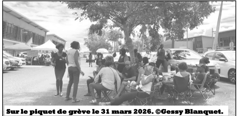
Sur le piquet de grève le 31 mars 2026. ©Gessy Blanquet.

néral et les représentants des syndicats. Ce fut l'occasion pour plusieurs d'entre eux de dénoncer les conditions de travail de plus en plus difficiles. Manque de formations pour les demandeurs d'emploi, application des règles de l'assurance chômage qui génèrent la colère et l'agressivité des chômeurs, inégalités de traitement de la carrière des agents. Les grévistes ont suspendu le mouvement après avoir obtenu l'ouverture de négociations sur trois jours en juin avec la direction générale sur la plate-