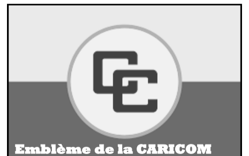
Emblème de la CARICOM

On peut constater que les conditions de vie des classes populaires ne s'améliorent pas dans les autres pays de la CARICOM. Il y a toujours du chômage dans ces pays comme à Sainte-Lucie où l'on recense 17 % de chômeurs ou encore 16 % à Grenade. En Haïti, l'extrême précarité a continué de croître après l'entrée de l'État haïtien en 2002.