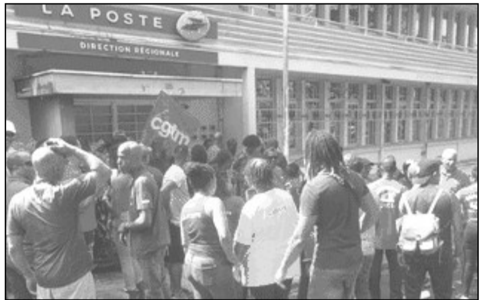
■ Les grévistes mobilisés devant le centre administratif de Clarac, à Fort-de-France.

An kout gôje pa mové pou fê tout' bagay maché. Woulo ba yo !