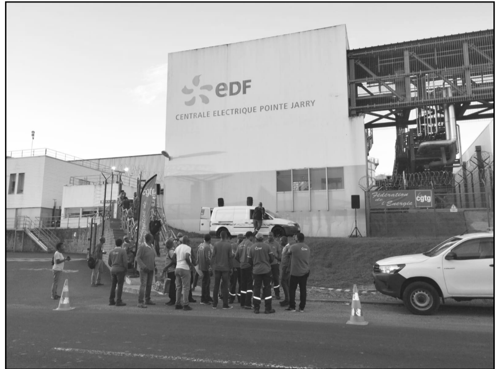
Les agents d'EDF PEI devant la centrale de Jarry en 2023.

La justice coloniale a décidé de s'attaquer aux grévistes. Quinze salariés avaient été placés en garde à vue en juin 2025. En traitant les grévistes de malfai-