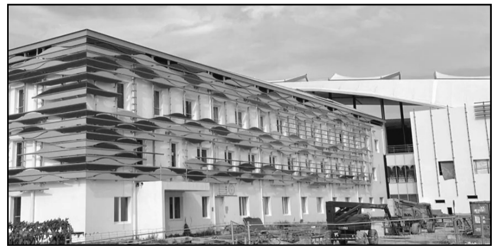
Le nouveau CHU de Belle-Plaine aux Abymes.

C'est oublier combien de reports ont déjà eu lieu pour malfaçon. C'est oublier aussi que ce nouveau CHU comportera moins de lits que l'ancien, 556 lits contre 618 actuellement et 656 en 2015. Moins de lits, donc moins de personnel et moins de capacité d'accueil.