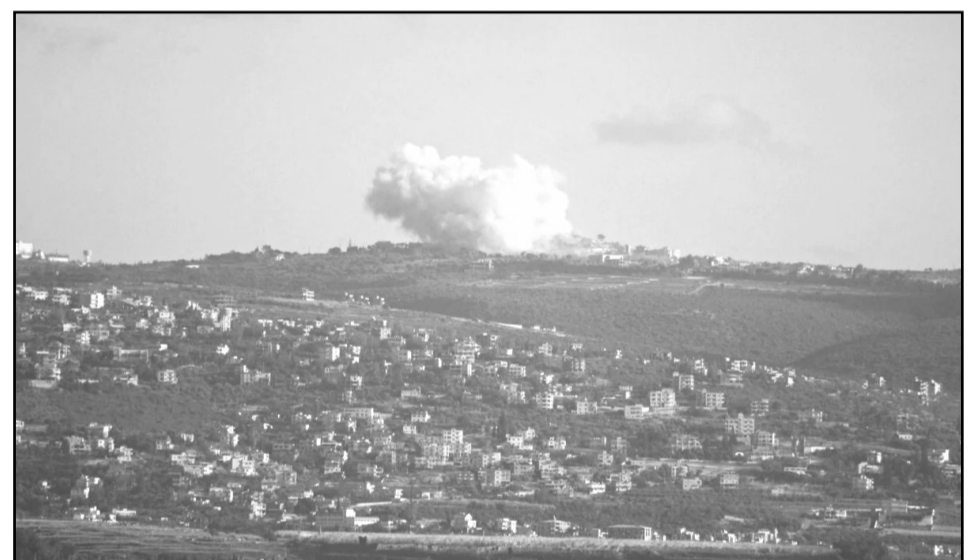
Un nuage de fumée au-dessus du village de Chamaa, au Liban-Sud, le 1er mai 2026, après un dynamitage par l'armée israélienne.

Cet état de guerre quasi permanent est entretenu par Israël depuis sa naissance, en 1948. Cette politique a conduit l'armée israélienne à occuper durablement la Cisjordanie après la guerre des Six-Jours en 1967, à envahir le Liban à plusieurs reprises à partir de 1978 et à occuper le sud de ce pays entre 1982 et 2000. Aujourd'hui l'armée israélienne, galvanisée par le gouvernement d'extrême droite de Netanyahu, accélère sa politique de colonisation et d'installation durable au delà de ses frontières actuelles.