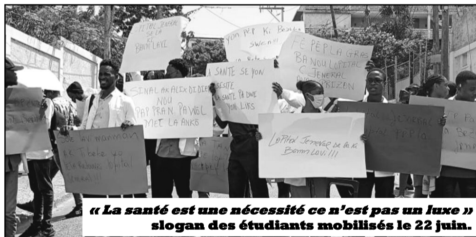
« La santé est une nécessité ce n'est pas un luxe » slogan des étudiants mobilisés le 22 juin.

Ils se sont dirigés vers la résidence du premier ministre Alix