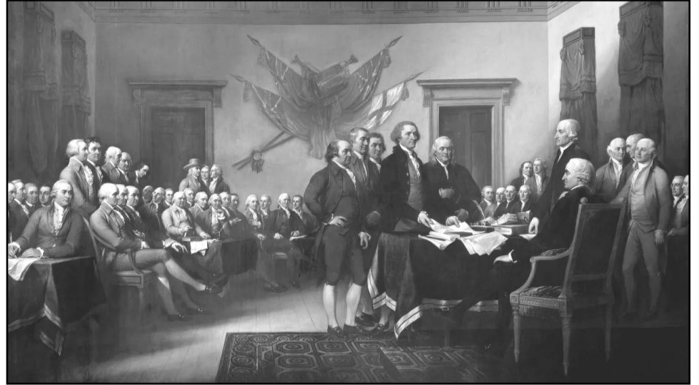
J. Adams, R. Sherman, R. Livingston, T. Jefferson, B. Franklin devant le texte de la Déclaration d'indépendance au Congrès, le 28 juin 1776.

En 1852, Frederick Douglass, ancien esclave devenu l'un des principaux défenseurs de l'abolition, fut invité le 5 juillet à faire