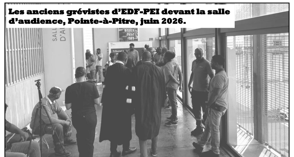
Les anciens grévistes d'EDF-PEI devant la salle d'audience, Pointe-à-Pitre, juin 2026.

Dans ce procès, les avocats de la défense ont montré les nombreux dysfonctionnements de la centrale et des défaillances tech-