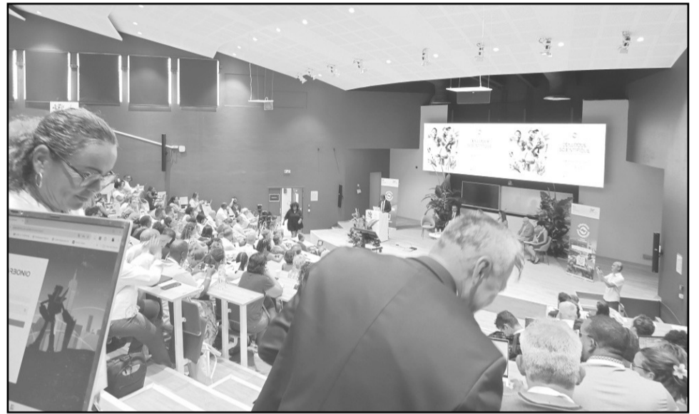
Au colloque sur le chlordécone.

Ce genre de colloque sert surtout de cache sexe aux autorités qui font semblant d'agir. Ceci, tout en continuant à détourner le regard sur ceux qui sont les véritables responsables de cette catastrophe.