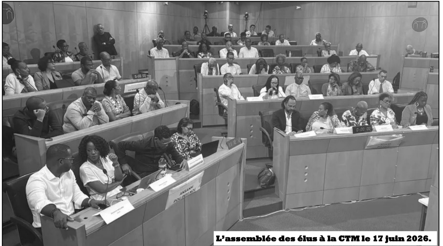
L'assemblée des élus à la CTM le 17 juin 2026.

Avec un nombre d'homicides atteignant les 40 en 2025 dont 34 par armes à feu, et 14 homicides sur les premiers mois de 2026 dont 13 par armes à feu, la situation s'aggrave. Elle frappe particulièrement une jeunesse sans perspective et souvent désœuvrée. Les violences dans le milieu familial sont en augmentation et ont souvent pour cause une situation sociale dégradante. Depuis des années, élus, services de l'État, ou acteurs de l'insertion, essaient de contenir les dégâts. En réalité, ils se contentent au mieux d'accompagner la dégradation de la situation avec des « rustines ». Mais ils ne se donnent pas les moyens réels d'y remédier, notamment en exigeant des mesures d'ur-