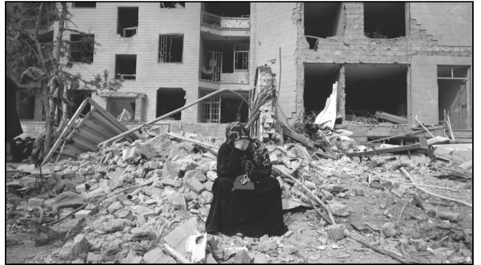
Assise sur des décombres après un bombardement américain à Téhéran, en Iran, le 12 mars 2026.

niens et ceux du Hezbollah libanais veulent prouver qu'ils résistent au géant américain et leur chien de garde, Israël.